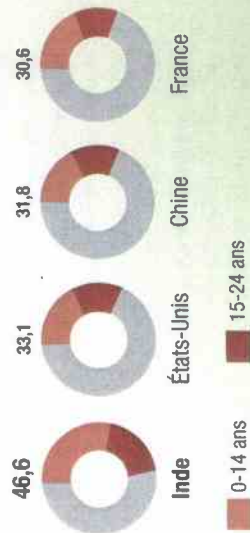
Part des moins de 25 ans dans la population (2014, estimations, en %)

Source : Courrier international , "Une jeunesse indienne", n° 1 222, 3-9 avril 2014.